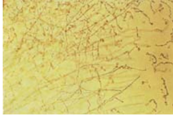
Şekil 2. Septalı hif

Tanımlamada karbon kaynağı olarak glikoz, galaktoz, maltoz, sakkaroz, mellibioz, laktöz, selibiyoz, rafinoz ve nişasta kullanılmıştır (Tablo 1).